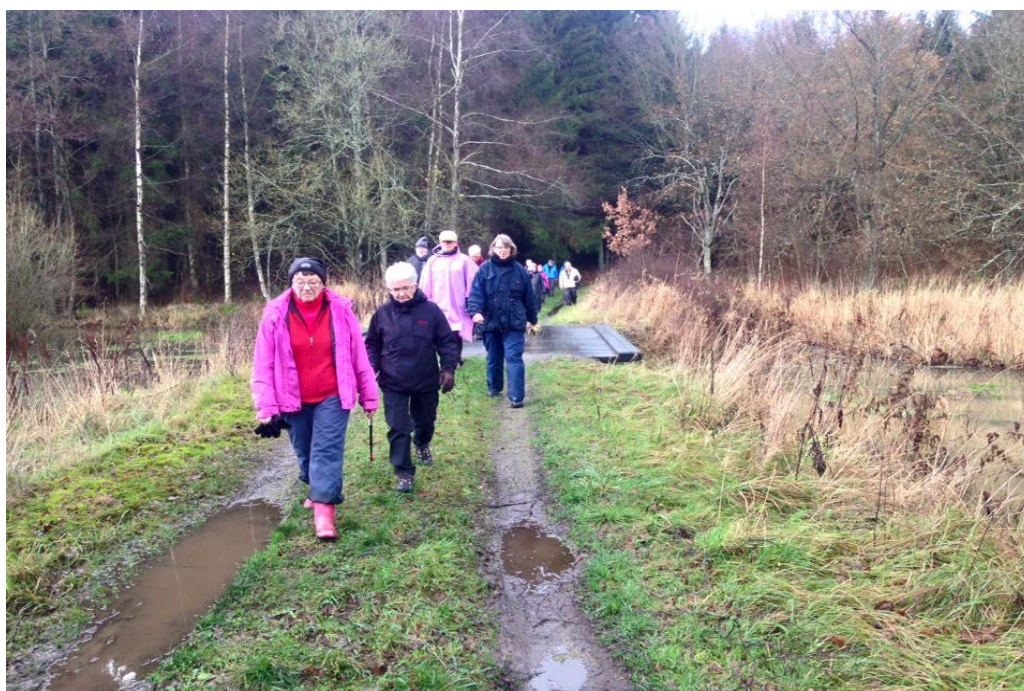
I regntøj på Egeskovvej